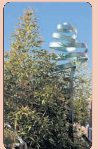
> 'Losbol', kunstwerk van Liedeke Veninga

9 juni, 12.00 tot 16.30 uur, Zes hofjes, Verhalenfestival