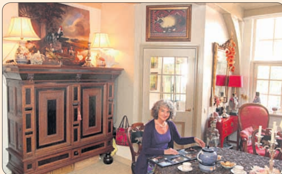
≥ 'Minder is meer' is haar motto

Op een tentoonstelling van zondagsschilders in de Nieuwe Kerk werd haar naïeve stijl, die haar nog steeds dierbaar is, ontdekt. Het Historisch Museum kocht één van haar werken en galerie Hamer nam haar freelance in dienst. Dat was het begin van haar schilderscarrière.