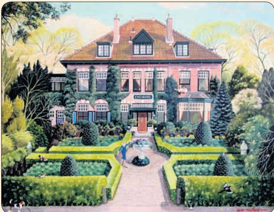
• Huizen en poezen schildert Agnès in opdracht